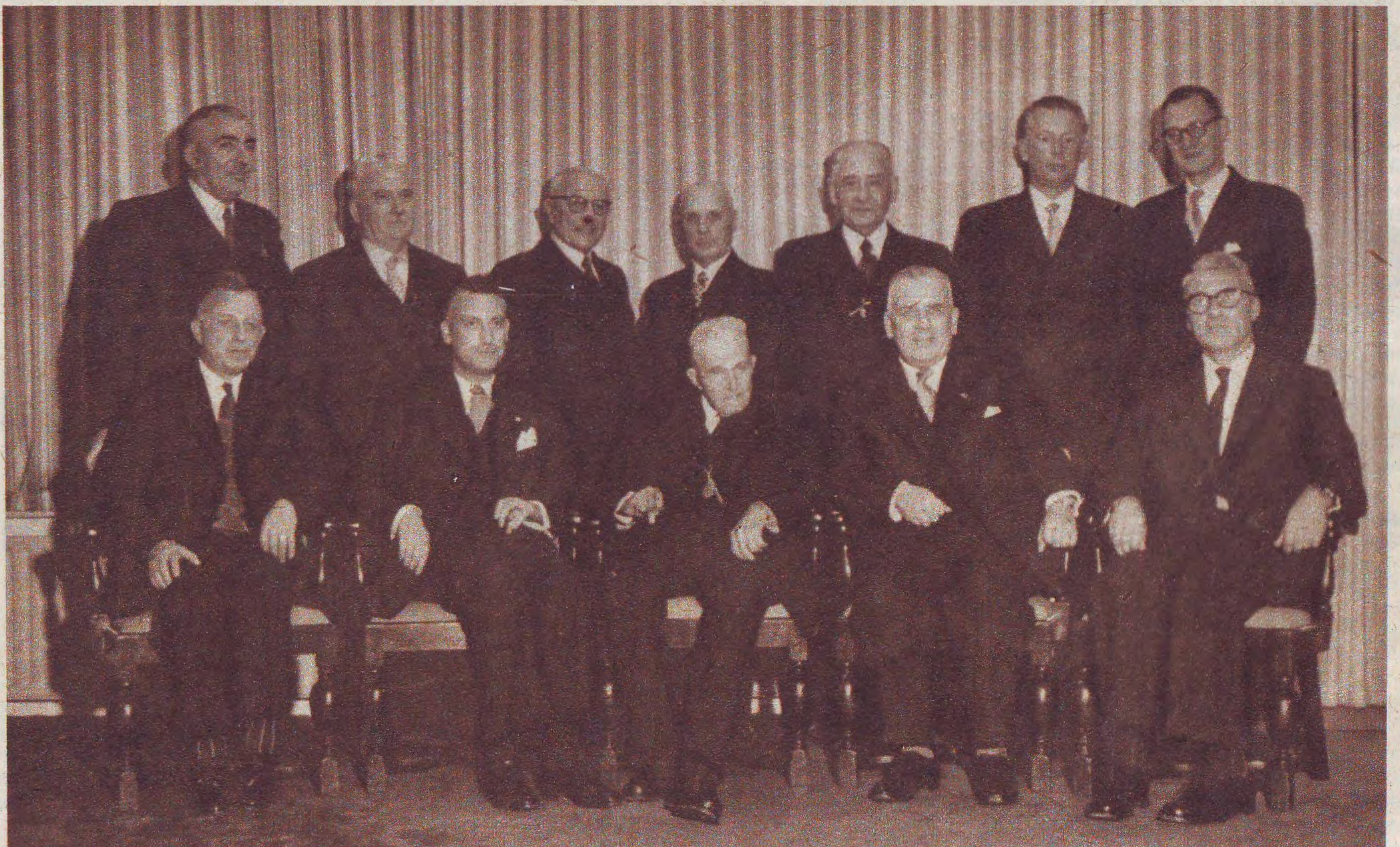
Het voltallige bestuur bijeen ten huize van de voorzitter te Warmond. Ook de ere-voorzitter wilde hier gaarne bij tegenwoordig zijn. Een ietwat sombere foto. Zelfs het enthousiasme van onze gastvrouw, die de fotograaf ijverig assisteerde, kon hierin geen verandering brengen. En dat wil wat zeggen!

24—26 Jan. 1890 „Oefening en Ontspanning“, Den Bosch;