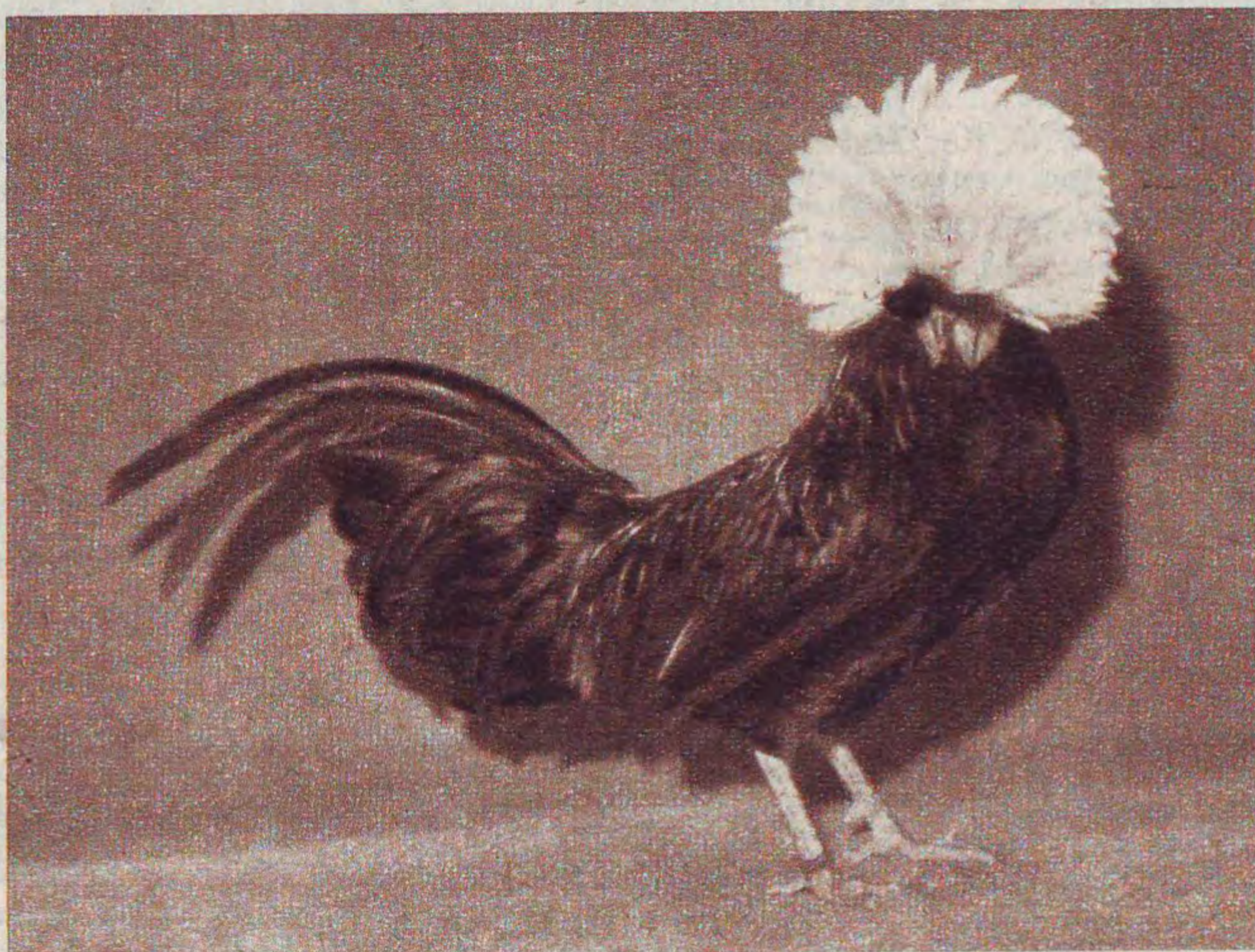
Links: Zwarte Hollandse Witkuif, haan

„Avicultura” heeft in de driekwart eeuw van haar bestaan niets onbeproefd gelaten om de raskleinveeteelt in ons land te bevorderen. We mogen haar daarvoor zeer dankbaar zijn, want anders had onze nationale rasfokkerij nooit zo'n grote bloei kunnen beleven als thans. Een bloei, die zich onder anderen manifesteert in de grote verscheidenheid van rassen, waarvan hieronder slechts een klein voorbeeld.