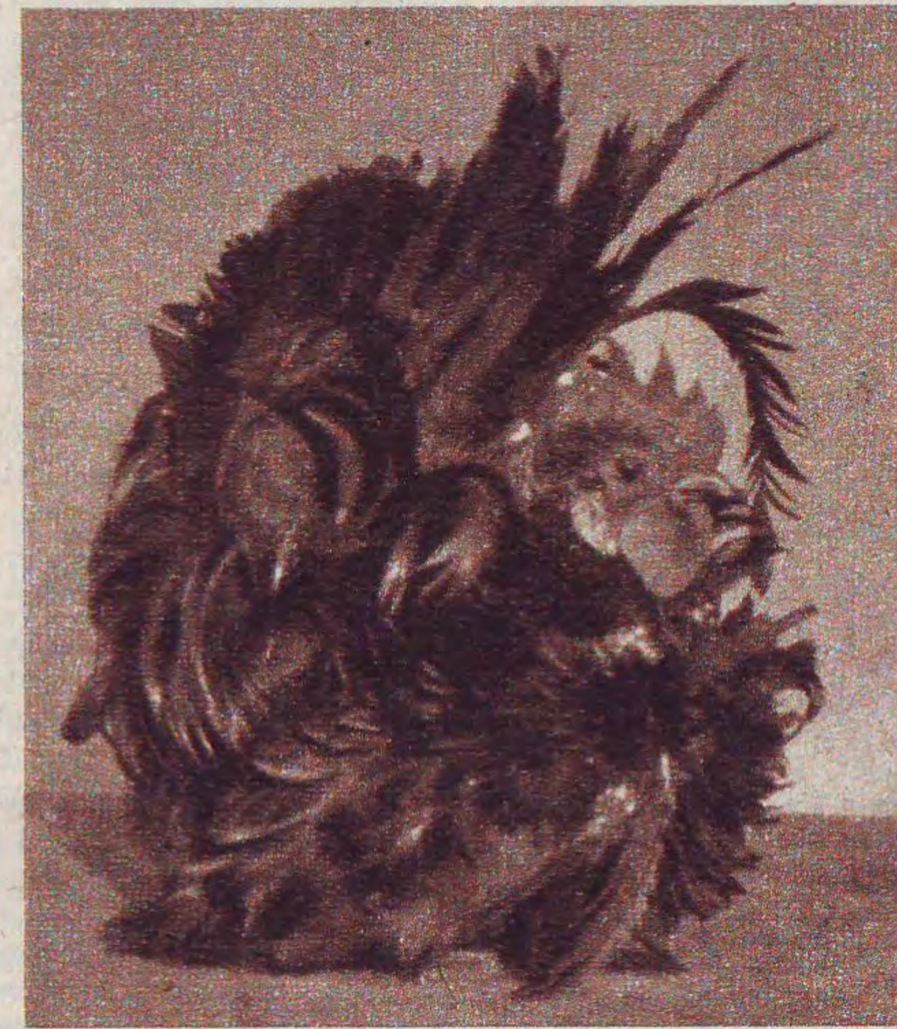
Rechts: Kruvederige Japanse Kriel, haan