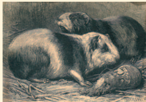
Guineesche biggetjes ( Cavia pourcellus ), getekend in 1896 (afbeelding archief Anneke Vermeulen-Slik).

Na de Tweede Wereldoorlog zien we haar helaas