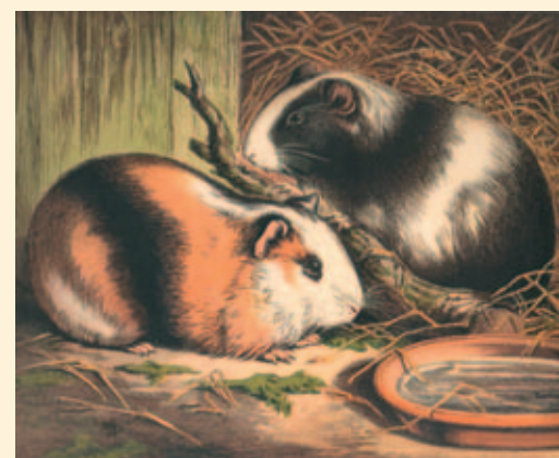
Cavia's uit omstreeks 1870.

pure vleesverzorging was bij deze kleine knager, is niet meer te achterhalen. Ontegenzeggelijk staat vast dat de cavia's bij de Inca's niet zo nauwgezet in de behuizing werden gehouden, zoals wij dat thans doen. Men vond ze daar in vrij grote ruimten en meestal in de buurt van de keuken. Vandaag de dag nog, dienen zij daar overwegend als vleesleverancier, vandaar dat ze bij de keuken werden gehouden, terwijl ook keukenafval als voedsel werd verstrekt. Thans vindt men nog in restaurants in Peru caviavlees op de menukaart en wordt dit als een delicatessie beschouwd. Het moet de smaak bezitten van een speenvarken, maar weten wij nog hoe de smaak van een speenvarken is?