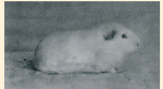
De winnende cavia op de gouden jubileumtentoonstelling. De beoordeling geeft verder aan: Massieve witte zeug, die het ideaal sterk benaderd en de enorme schouderpartij wordt geprezen. De foto's waren in die tijd nog niet best.