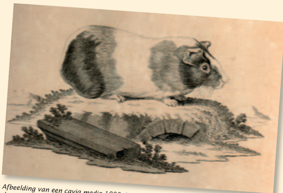
Afbeelding van een cavia medio 1800. In vele opzichten lijkt het diertje nog niet op de cavia's, zoals we die nu kennen.

Cavia's onderscheiden zich behoorlijk, qua grootte. Naast de ons bekende cavia behoort ook het grotere en nog levende watervarken van zowat een meter,