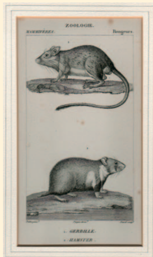
Een gerbil en een hamster medio 1800. Ook uit deze afbeelding is duidelijk te zien hoe deze diertjes inmiddels veranderd zijn.

tot deze knaagdiengroep. De oorspronkelijke cavia's bevolkten Zuid- en Midden Amerika in een groot aantal verscheidene soorten. Heck onderscheidt ze in twee grote groepen. De eerste groep is de behendige watervlugge loper, de bergcavia en de tweede groep is de iets grotere laaglandcavia. Deze laatste kan wel 2,5 kg worden.