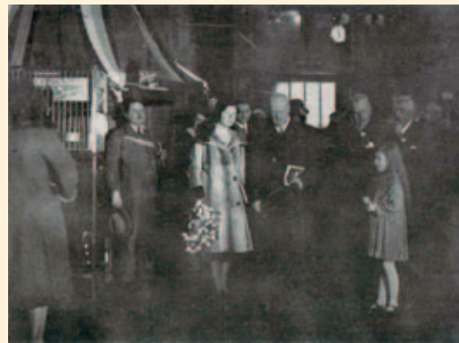
Opening van de Avicultura in 1936 door Z.K.H. Prins Hendrik.

niet meer terug in de hobby. Zij zou vanwege haar huwelijk met een Canadese officier betrokken zijn naar Canada.