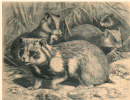
Hamsters, ook getekend in 1896.