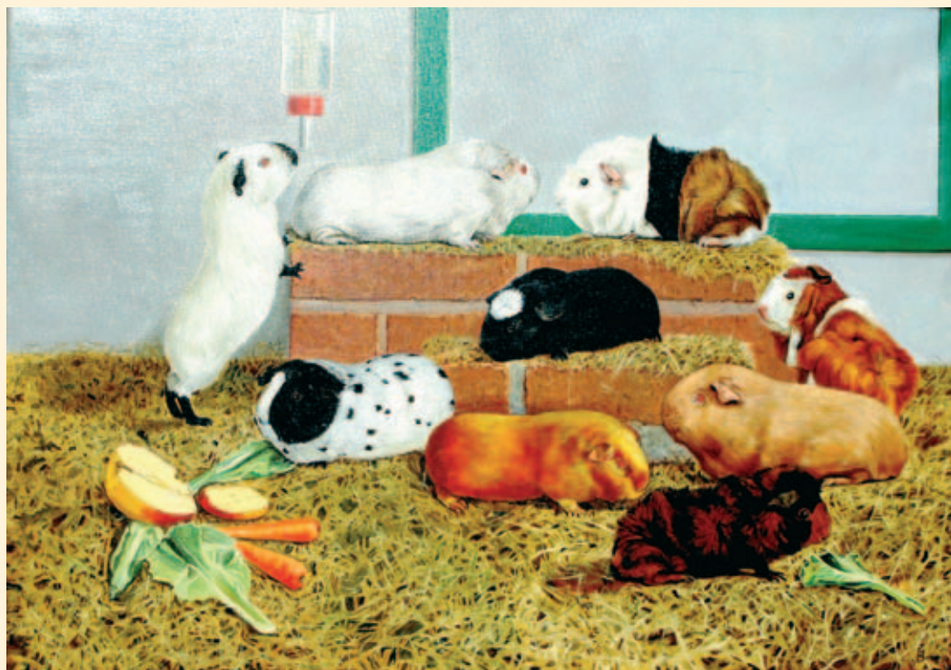
Schilderij van diverse cavia's. In opdracht van Avicultura geschilderd door Henk Bras in 1994 en uitgegeven als bijlage van het Kersnummer in 1994. Al sinds jaren siert deze plaat de cover van het leerboek voor caviakeurmeesters (schilderij en foto Hans Ringnalda).

Cavia en kleine knaagdierenliefhebbers lijken soms net even wat meer liefhebber, dan de overige kleindierliefhebbers, vindt u ook niet?