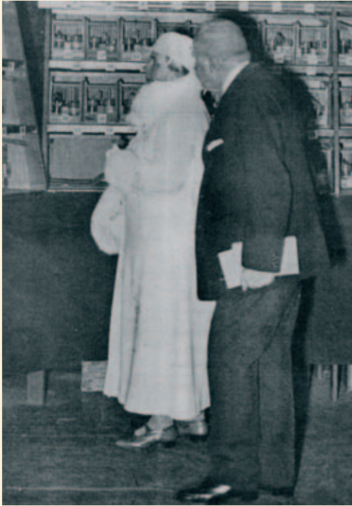
H.M. koningin Wilhelmina opent de 50 ste , ofwel gouden Internationale jubileumtentoonstelling van Avicultura en wordt rondgeleid door voorzitter Baron G.J.A.A. van Heemstra. Er wordt verder vermeld dat zelfs de konijnenafdeling werd bezocht, die zoals gewoonlijk afzonderlijk werd gehuisvest. Verder stelde Hare Majesteit medailles ter beschikking van het Koninklijk Huis.