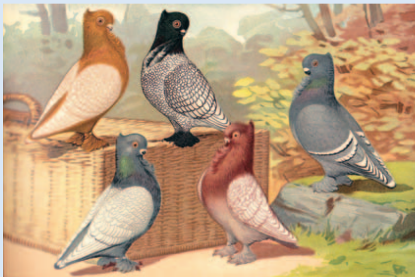
Een groep Oosterse meeuwen, blondinetten uit het beroemde boek van Emil Schachtzabel (1909). (Archief W. Halsema).