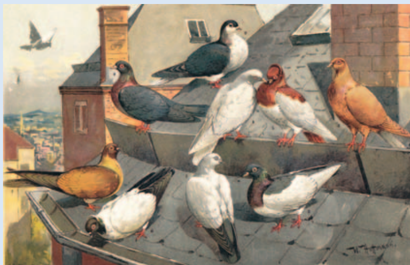
Prachtige plaat met tuimelaars uit Geflügelbuch van C.G. Friderich (1896). De Lahore (bovenaan) werd toen nog tot de tuimelaars gerekend. (Archief W. Halsema).

Wijs geworden door de ervaringen kwamen op 22 juli 1923 een aantal mensen in Utrecht bijeen, om een organisatie op te richten die de zich ten doel stelde de sierduiventelt in de meest uitgebreide zin des woords in Nederland te bevorderen. Het bijzondere van deze vereniging was dat men besloot dat alleen verenigingen lid konden worden van deze organisatie, aldus werd besloten tot de oprichting van de Nederlandse Bond van Sierduivenliefhebbers-verenigingen, kortweg de N.B.S. Om aan alle zaken enige structuur toe te kennen, werd er (later) een standaardcommissie, examencommissie en keurmeestervereniging in het leven geroepen. Avicultura en haar blad bestonden toen al 37 jaar. Maar er was nog meer,