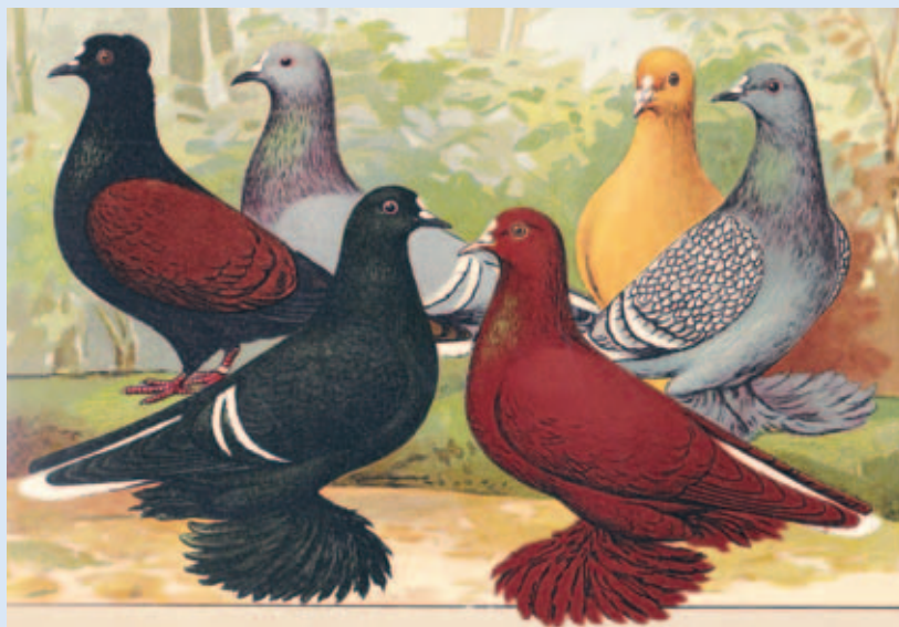
Een groep Thüringer en Saksische witstaarten ook uit het boek van Schachtzabel, 'Illustriertes Prachtwerk sämtlicher Taubenrassen' uit 1909.