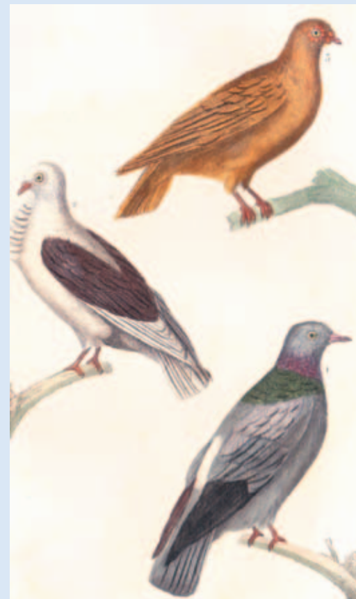
De eerste gekleurde duiventekeningen stonden vermeld in ornithologische werken. Hier zijn een Valkenet (boven), een Meeuw (midden) en een Rotsduif (onder) afgebeeld, uit Buffon, 1825.