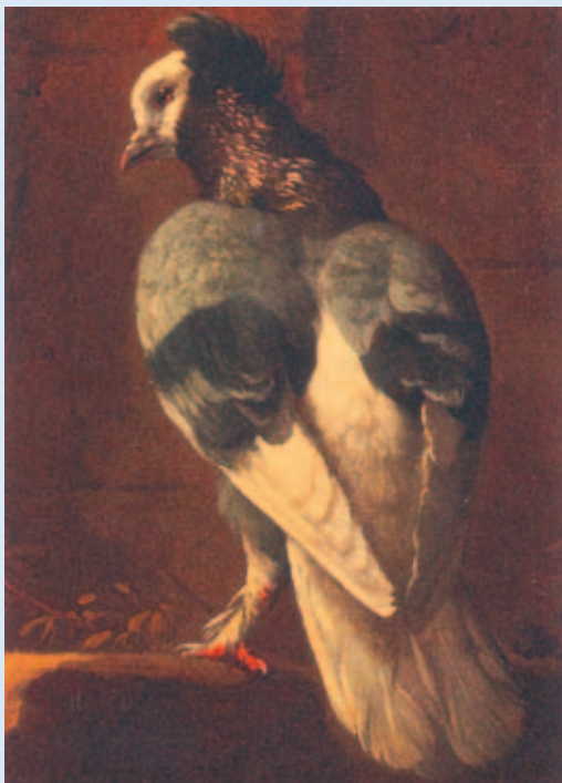
Detail van het schilderij 'De Hoenderhof' van d'Hondecoeter, ca. 1660-1665 met een prachtig gedetailleerd geschilderde ringslager.

Wat is 125 jaar in historisch perspectief gezien, eigenlijk helemaal niets! Gezien de leeftijd van onze planeet, staat dit getal gelijk aan een 'zuchtje' wind. Toch is 125 jaar meer dan een mensenleeftijd en als dan een specifiek blad voor kleindieren haar 125 jarig jubileum mag vieren, dan is dat zeker memorabel. Wij blikken hier terug op de sierduivensport gedurende die periode en voor de volledigheid, kijken we ook nog verder terug.