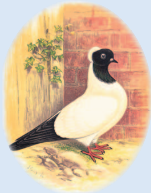
Nonduif uit 'Fancy Pigeons' van J.C. Lyell (1887). De Nonduif is van oorsprong een Nederlands ras, maar de Engelsen hebben het veredeld. (Archief W. Halsema).

hebben duiven zich in de onmiddellijke nabijheid van mensen opgehouden. Vooral in de oosterse landen, waar de meeste tamme duivenrassen vandaan komen, wonen ze nog steeds met mensen onder één dak. Al snel bemerkte de mens de bijzondere eigenschappen van de duif, de gehechtheid aan zijn onderkomen en het uitstekend ontwikkelde oriënteringsvermogen.