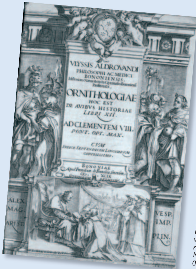
Vooraanzicht van het boek 'Ornithologiae' van Ulyssis Aldrovandi. Dit boek beschreef voor het eerst de rasduivenfokkerij in Nederland in 1599.

Duiven bestonden al in de verre oudheid. De duif behoort tot één van de allereerste diersoorten, die als huisdier werd gehouden. Het domesticeren van duiven heeft in de alleroudste tijden plaatsgevonden. De aard en het karakter van de duiven leenden zich daar bijzonder voor en door alle tijden heen